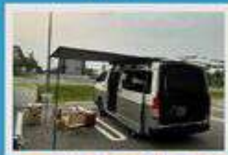
*ご利用者の投稿写真