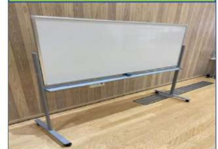
4대/전체 W180×H190 기립 부 W180×H90