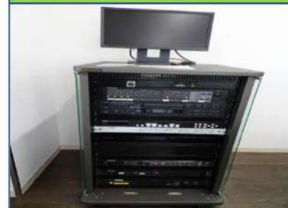
1대/재생 매체 (블루 레이/DVD/CD/SD/USB)