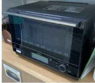
오븐 범위 NE-BS808