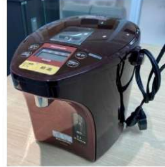
전기 포트 NC-SU224